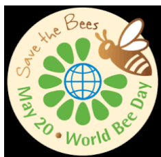
Světový den včel - znak

D en narození Janši – 20.květen byl také vybrán jako světový den včel. Janša zemřel mlád dne 13.9. 1773 ve věku 39 let. Slovinští včelaři jej mají ve velké úctě a představuje pro ně tradici.