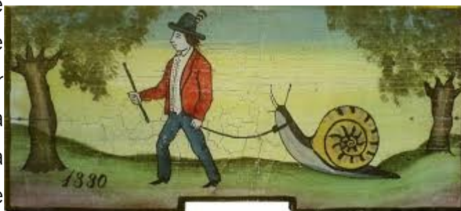
Dřevěná malovaná destička umístěvaná na přední stranu úlu

Anton Janča (Janscha) se stal prvním učitelem včelařství na císařském dvoře ve Vídni. Narodil se do prosté rolnické rodiny 20.května roku 1734 ve vesnici Breznica v regionu Horní Kraňsko, součást rakousko-uherské říše, dnešní Slovinsko. Jeho rodný dům v Breznici se dochoval až do roku 1907. Jako mladý Anton Janša projevoval malířský talent, stejně jako jeho dva bratři Lovro a Valentin. Zařídili si ve stodole jednoduché malířské studio. V roce 1776 všichni tři bratři, ač byli v podstatě negramotní odešli do Vídně a začali se zabývat kresbou – mědiritinu. Bratr Lovro dokončil malířskou školu a později se stal profesorem na malířské akademii ve Vídni. Anton se i přes svůj malířský talent rozhodl stát včelařem. Od roku 1769 se včelařství věnoval naplno. A tak vlastně pokračoval ve svém zájmu z mládí, kde včely a jejich život poznal v domě svého otce. Doma měli více jak 100 úlů, scházeli se u nich sousedé, diskutovali o chovu včel a vzájemně si vyměňovali zkušenosti.