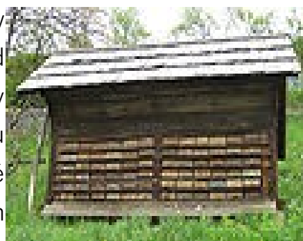
Typický slovinský včelín - čebelnjak

Po smrti Antona Janši vydala Marie Terezie dekret, podle kterého si všichni včelaři museli prostudovat jeho knihy. Proslavil se také tím, že jako včelař měnil velikost prostoru pro včely – úlů a také tím, že je bylo možno skládat do bloků. Jelikož byl výborným malířem, maloval také přední strany úlů různými kraňskými motivy, které znázorňují různé lidské profese. Používal k tomu olejových barev. Na počátku 20. století v souvislosti s moderními přístupy ke včelařství, trend malování na úly ustoupil do pozadí. Malování na úly bylo a je typické především pro slovinskou alpskou oblast. Ukázky malovaných úlů jsou dnes dostupné především v různých muzejích a soukromých sbírkách. Janša také objevil a popsal mateří kašičku, popularizoval Scopoliho objevy o včelách.